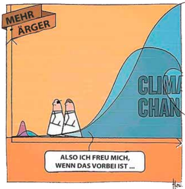
Cartoon: © Statistically Insignificant by Raf S.

Jede Krise birgt auch eine Chance in sich. Versuchen wir die Pandemie als Weckruf zu verstehen und reflektieren wir, warum es überhaupt so weit kommen konnte. Für das Klima gibt es leider keinen Impfstoff. Darum müssen wir mehr denn je zuvor aus dieser selbst verschuldeten globalen Krise die richtigen Schlüsse ziehen.